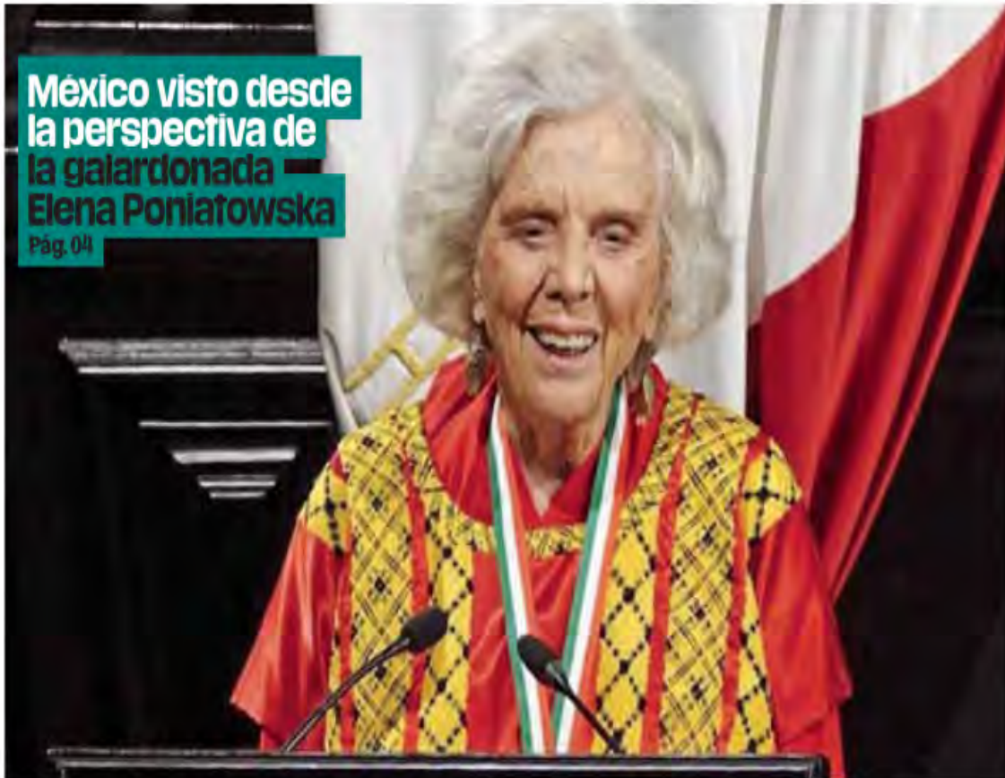
Senado. La escritora Elena Poniatowska recibió la medalla Belisario Domínguez por su amplia trayectoria en el mundo de las letras.

México visto desde la perspectiva de la galardonada Elena Poniatowska Pág. 04