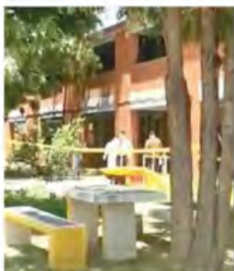
CAPTURA DE VIDEO

Comercios y restaurantes anuncian que se seguirán amparando contra reglamento antitabaco