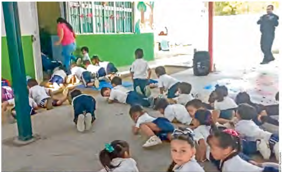
SIMULACRO... DE BALACERA. Alumnos de un jardín de niños de Culiacán son entrenados para actuar ante un ataque armado y entran pecho tierra a su salón. En tanto, a nivel nacional se realizó un simulacro de sismo; en la Ciudad de México los altavoces funcionaron al 99.2% P. 7 Y 10