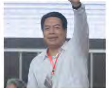
El dirigente nacional de Morena, Mario Delgado, reiteró su compromiso de trabajar para el crecimiento de la 4T.

TEPJF AVALA AMPLIAR PERIODO DE DELGADO Y CITLALLI. P. 7