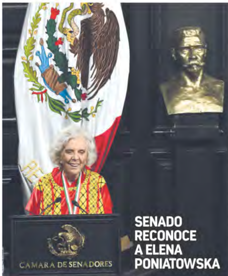
RECIBE MEDALLA. La periodista y escritora recibió ayer del Senado de la República la Medalla Bellasario Domínguez. Durante su discurso, en el que recordó parte de su actividad creadora, lamentó la ausencia en el evento del presidente Andrés Manuel López Obrador a quien, dijo, "queremos, y no sólo queremos, lo admiramos". Por Francisco Mendoza. Pág. 5

▶ A LOS MINISTROS NO LES INTERESA PACIFICAR EL PAÍS: SHEINBAUM