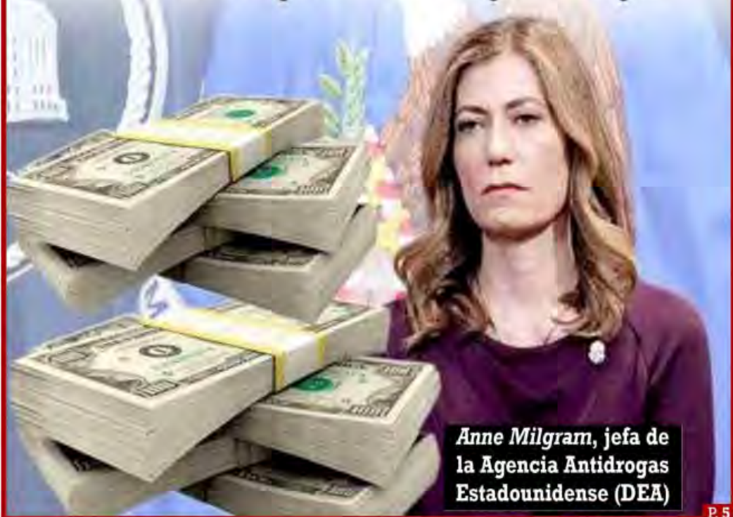
Anne Milgram, jefa de la Agencia Antidrogas Estadounidense (DEA)

La funcionaria habría otorgado contratos millonarios de manera irregular a sus antiguos colegas