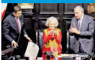
Elena Poniatowska recibió la Belsario Domínguez. Los senadores de Morena criticaron a la Corte por su fallo contra el paso de la Guardia al Ejército. Pág. 18