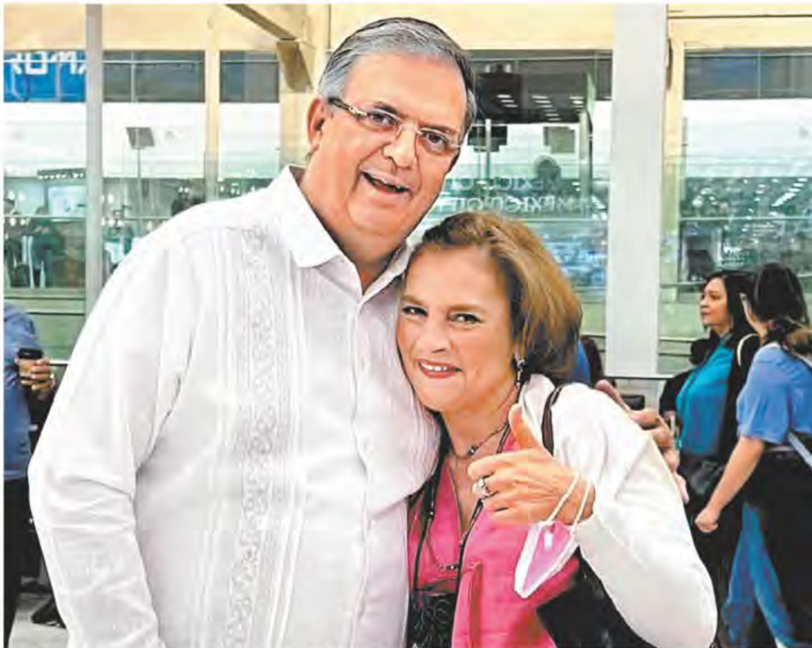
Beatriz Gutiérrez Müller, en compañía de Marcelo Ebrard en Tabasco, dijo que dejó a AMLO "guardadito y reposando".