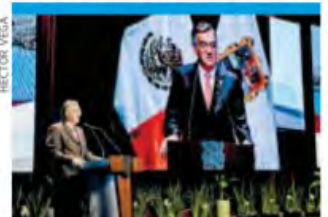
Américo Villarreal. "En Tamaulipas, nunca más una sociedad silenciada". Pág. 20