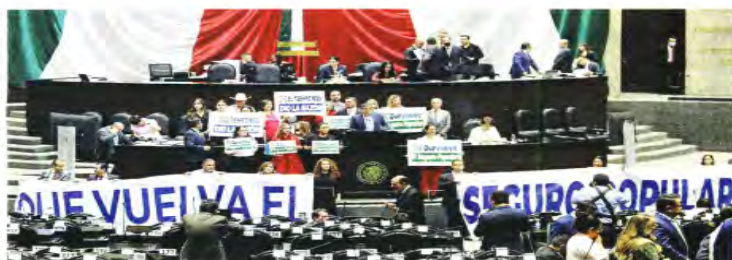
La Oposición protestó ayer en la Cámara de Diputados por la reforma a la Ley General de Salud y exigió retomar el Seguro Popular.

Ayer, con la dispensa de todos los trámites legislativos, la mayoría de Morena en la Cámara de Diputados aprobó la iniciativa de reformas a la Ley General de Salud, a tres horas de haber sido presentada ante el Pleno, con 267 votos a favor, 222 en contra y una abstención.