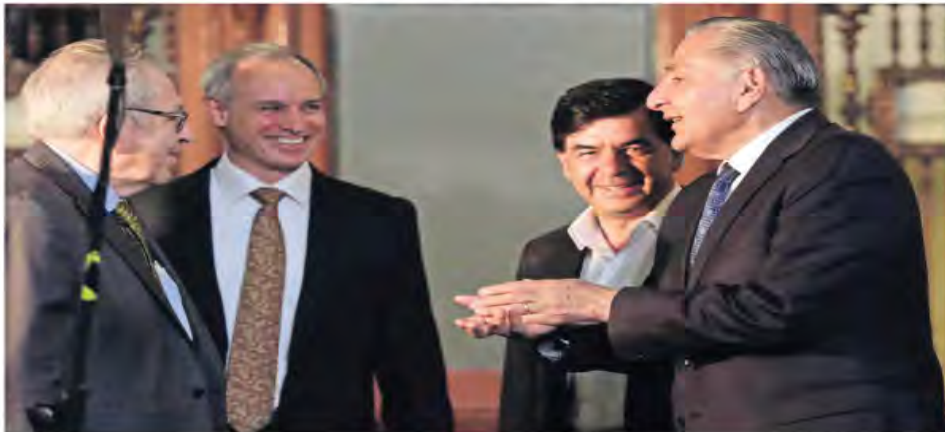
El secretario de Gobernación, Adán Augusto López, encabezó la mañana de ayer, en la que el titular de Salud, Jorge Alcocer, informó que el presidente Andrés Manuel López Obrador está bien tras dar positivo a Covid-19. En Tabasco, Beatriz Gutiérrez dijo que su esposo está en recuperación. Hoy se reúnen los gobernadores en Palacio Nacional. | A9 Y A8 |