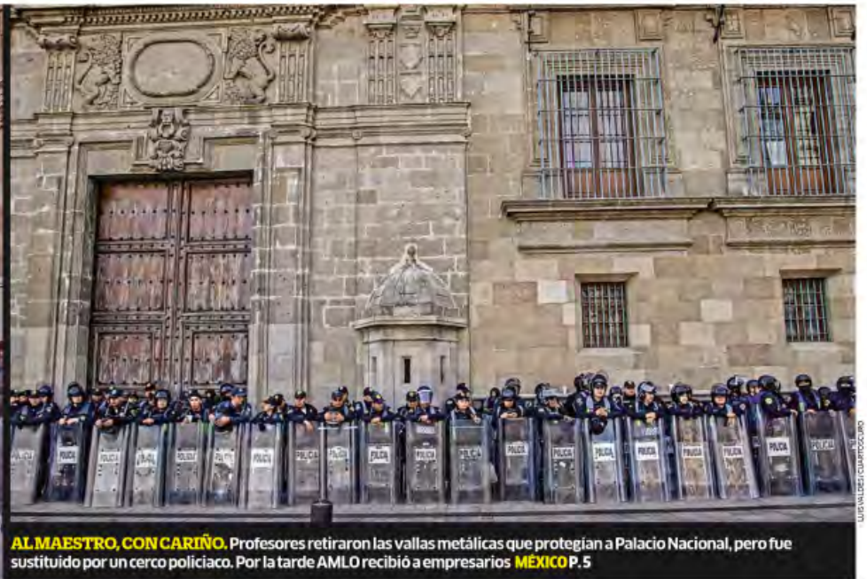
AL MAESTRO, CON CARIÑO. Profesores retiraron las vallas metálicas que protegían a Palacio Nacional, pero fue sustituido por un cerco policiaco. Por la tarde AMLO recibió a empresarios MÉXICO P. 5