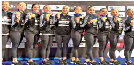
El representativo mexicano tuvo una destacada actuación en el Mundial en Egipto, con tres preseas de oro y una de bronce.