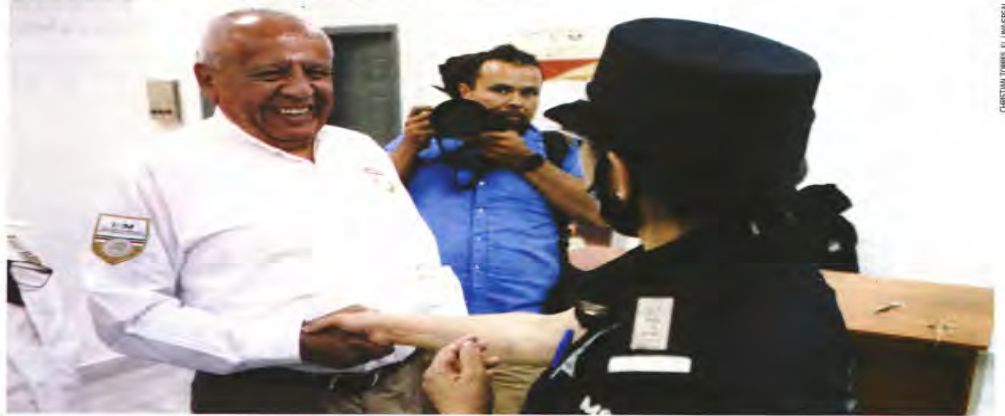
Ciudad Juárez, Chih. — A 50 días del incendio en la estación migratoria de esta ciudad—que costó la vida de 40 migrantes—, el titular del INM Francisco Garduño tuvo su primer acto público, en el que no escatimó en saludos y risas, pero se negó a hablar sobre su proceso penal. | A18 |