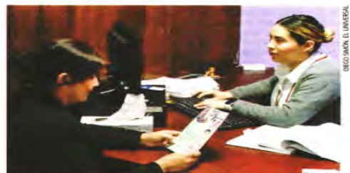
La unidad especializada atiende denuncias de acoso, abuso sexual y violación en contra de estudiantes de niveles medio y superior.