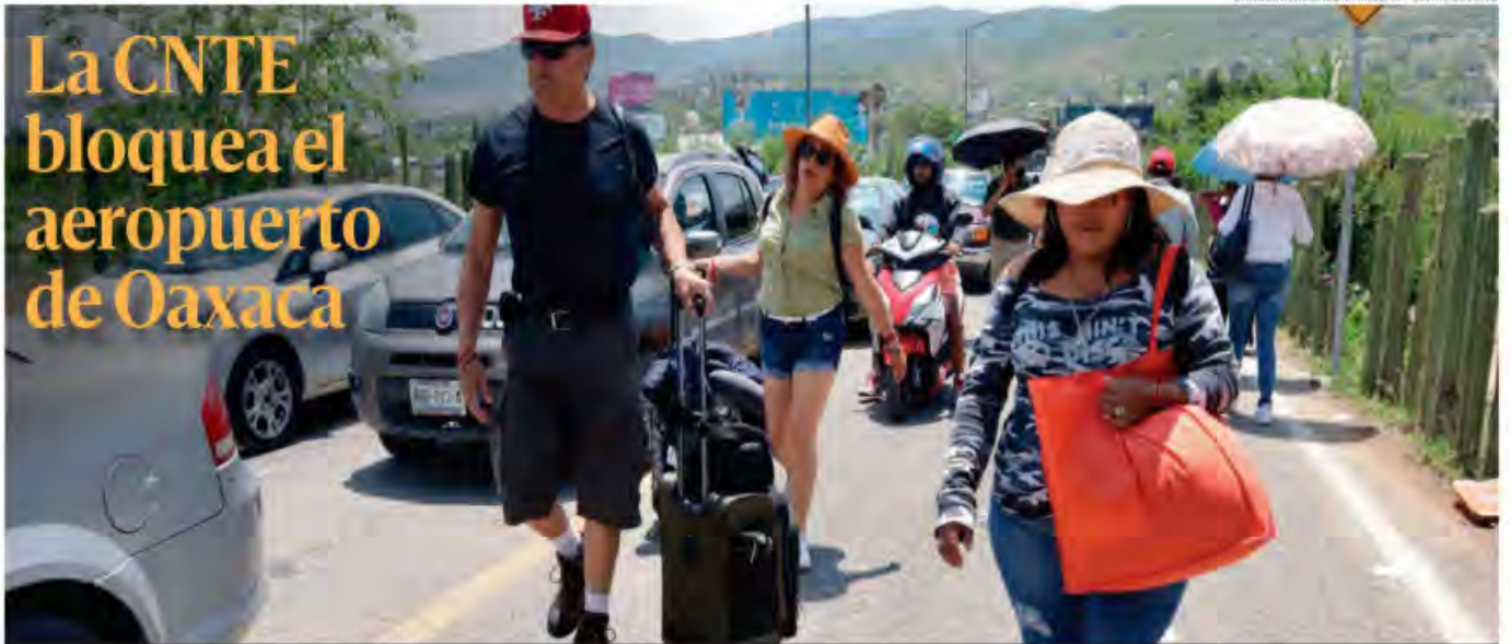
Decenas de profesores de la Sección 22 de la CNTE bloquearon ayer los accesos al aeropuerto internacional Benito Juárez en la capital de Oaxaca para exigir a las autoridades cumplimiento de sus demandas. Muchos turistas tuvieron que llegar caminando a la terminal aérea. PAG 9