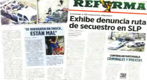
La carretera federal 57, de San Luis Potosí a Nuevo León, se encuentra bajo el control del crimen.

Buscaban a 23 en SLP; aparecen -mínimo- 51