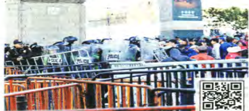
Maestros de la CNTE intentaron derribar la Puerta Mariana para ingresar a Palacio Nacional. LA CNTE EN REBELIÓN