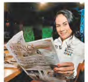
La candidata.

La secretaria de Seguridad, Rosa Icela Rodríguez, participó en la mañanera presidencial en compañía de los titulares de Defensa, Cresencio Sandoval, y de Marina, Rafael Ojeda, en la que se informó que hay una reducción de 28.8 por ciento en los delitos federales y se exhibió a tres jueces acusados de absolver a personajes como El Güero Palma, el alcalde de Piaxtla y José Luis Abarca. PÁG. 12