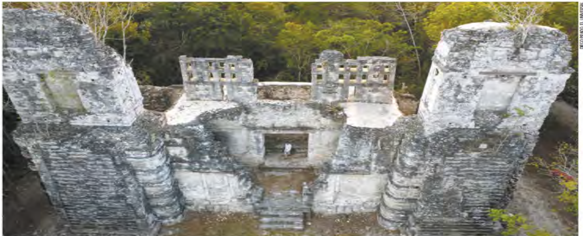
RECORRIDO EL UNIVERSAL