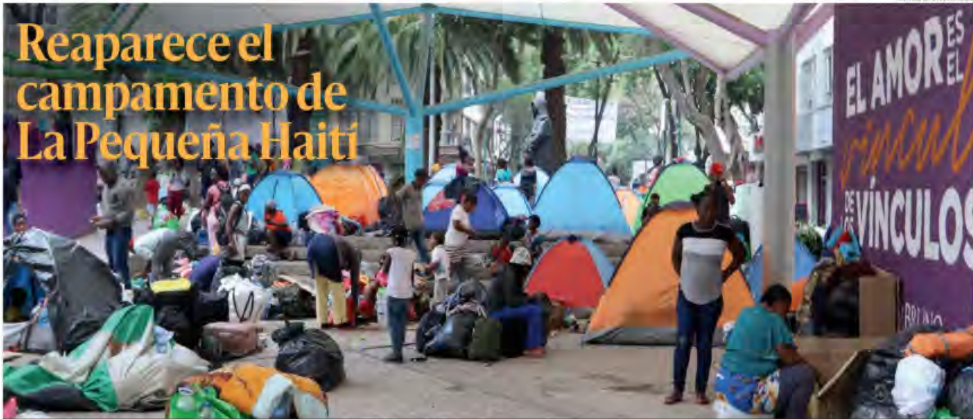
En la Ciudad de México más de 600 personas, en su mayoría familias completas de haitianos con sus niños, coparon ya la Plaza Giordano Bruno, en la colonia Juárez de la alcaldía Cuauhtémoc, conocida como la Pequeña Haiti.