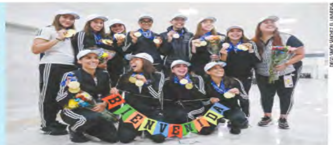
DELO MONSIEUR DEL UNIVERSAL

"Por mí, que vendan calzones, trajes de baño, Avon o Tupperware", dice la titular de la Conade a la Selección de Natación Artística. | B1 y B4 |