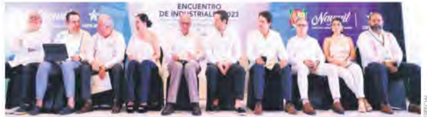
Encuentro de Industriales. Desde Nuevo Nayarit, la cúpula industrial llamó a tomar las oportunidades que abre la coyuntura

Retos. Preocupan deficiencias en infraestructura, seguridad y acceso a servicios públicos