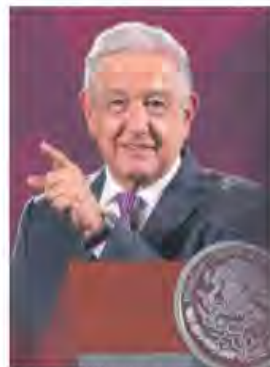
No imparten justicia. Sólo sirven a los potentados y delincuentes, dice AMLO