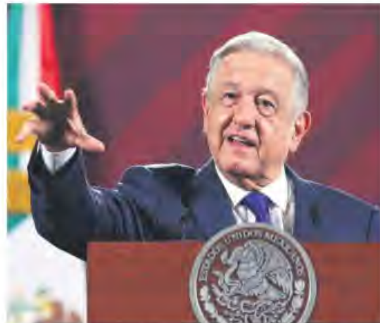
Asociación pública-privada. AMLO dijo que el país compraría Banamex.