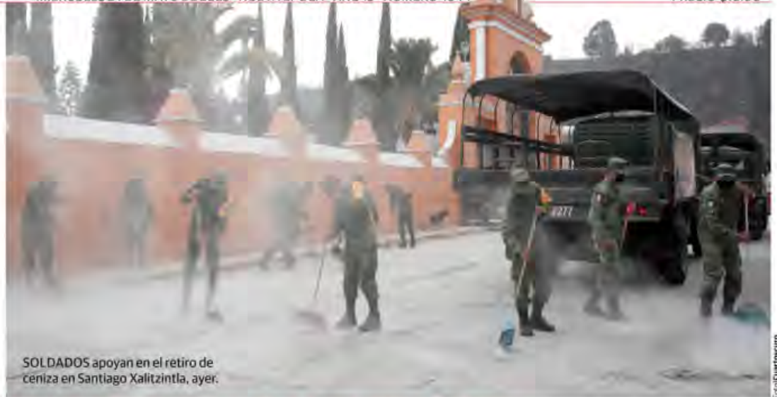
SOLDADOS apoyan en el retiro de ceniza en Santiago Xalitzi, ayer.

PRI vuelve a chocar con MC; acusa sabotaje, pero le pide sumarse a Alianza pág. 6