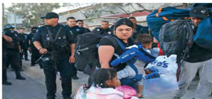
La mayoría de los migrantes desalojados de un campamento en Ciudad Juárez ya fueron reubicados.