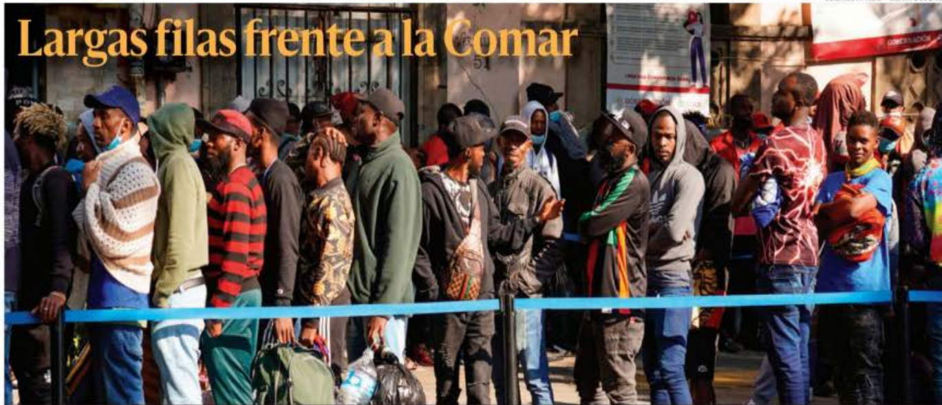
Migrantes de origen haitiano se forman desde muy temprano en las oficinas de la Comisión Mexicana de Ayuda a Refugiados (Comar) para buscar un documento que les valide su estancia legal en el país y puedan seguir hacia Estados Unidos.