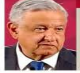
¿Sin residencias ni lujos?

2022. El General compró su depa de lujo en el condominio "Cuatro Puntos" de Bosque Real.