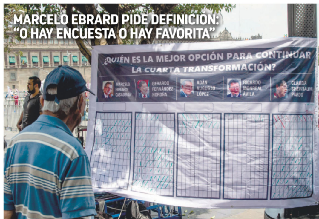
SIMPATIZANTES DE MORENA en la Ciudad de México realizaron un ejercicio de consulta vecinal en el que preguntaban "¿Quién es la mejor opción para continuar la Cuarta Transformación?", acompañando el cuestionamiento con las imágenes de los aspirantes presidenciales Marcelo Ebrard, Gerardo Fernández Noroña, Adán Augusto López, Ricardo Monreal y Claudia Sheinbaum. Pág. 4