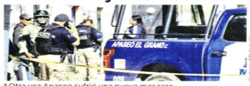
Otra vez Apaseo sufrió una nueva masacre.

GUANAJUATO.- Dos niñas de 7 y 11 años edad, su mamá, de 28, y su abuela, de 58 años, murieron ayer tras ser atacadas en su domicilio en Apaseo el Grande.