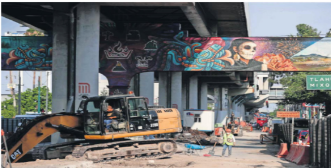
Pese al avance en las obras de reparación de la Línea 12 del Metro, aún no hay fecha de reapertura.