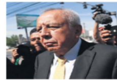
Francisco Garduño, titular del Instituto Nacional de Migración.