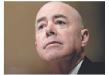
ALEJANDRO MAYORKAS , secretario de Seguridad Nacional de EU.