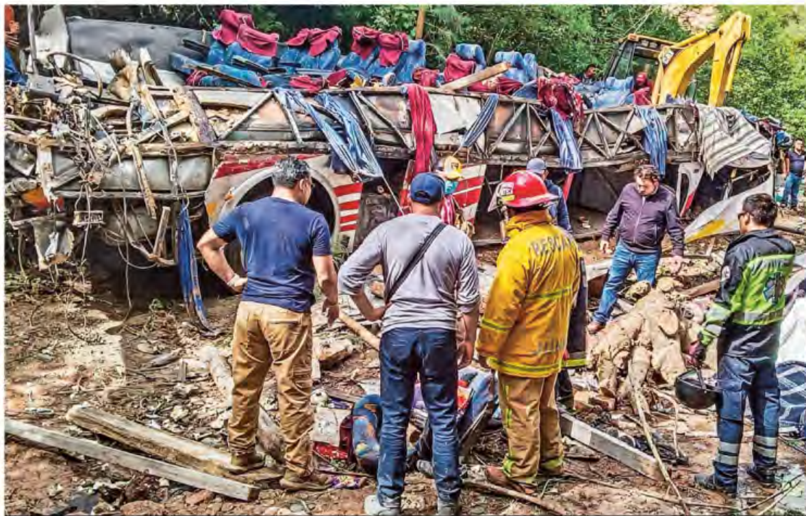
ACCIDENTE FATAL. Al menos 29 personas murieron y 18 resultaron heridas porque el autobús en el que viajaban se desbarrancó en Oaxaca. Mientras que en la carretera México-Querétaro una pipa provocó una carambola que dejó ocho heridos y nueve vehículos calcinados ESTADOS P. 11

SUPERPESO PUEDE ALCANZAR 16.40 UNIDADES POR DÓLAR EN 2024 NEGOCIOS P. 14