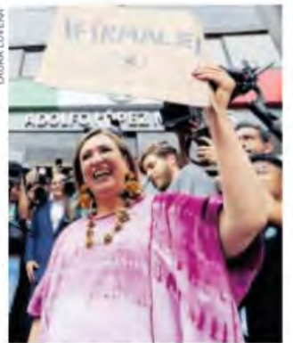
La Xóchitlmania no la hará perder el piso, dice.