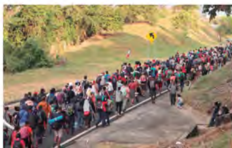
CARAVANA migrante, ayer rumbo a Escuintla, Chiapas.

Lanzan SOS Chicago, Denver, NY y Eagle Pass porque están rebasados; éxodo llega a Escuintla; Senado debe protestar frente a leyes que criminalizan a indocumentados: Montreal