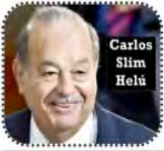
Carlos Slim Helú