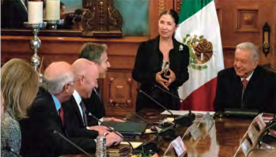
EL PRESIDENTE, ayer en Palacio con Elizabeth Sherwood-Randall, Ken Salazar, Alejandro Mayorkas y Antony Blinken.