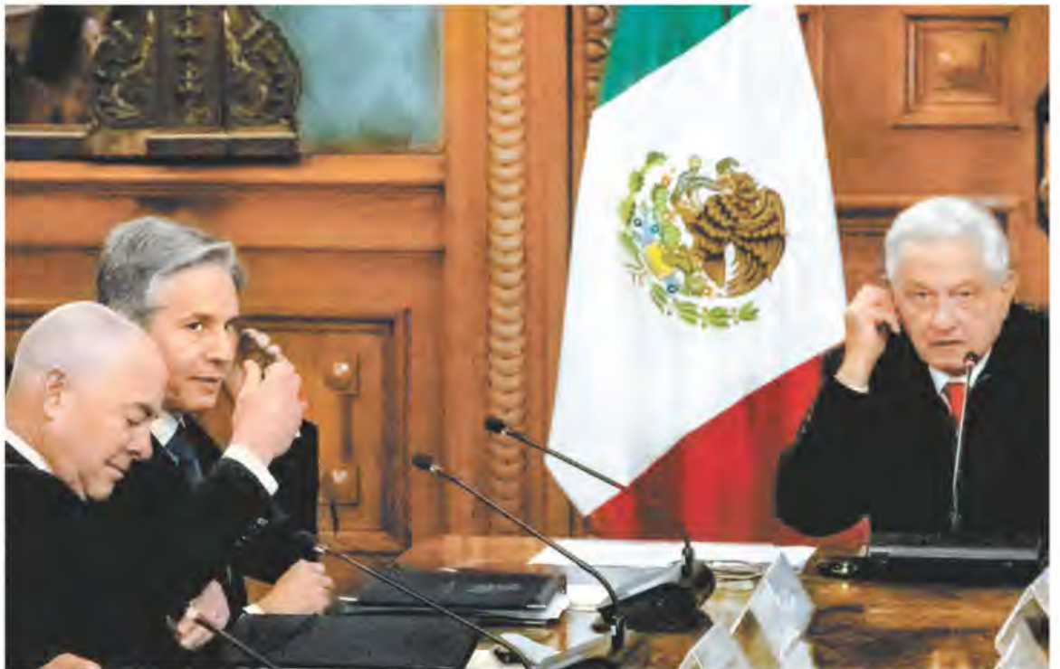
Alejandro Mayorkas y Antony Blinken, secretarios de Seguridad y de Estado de EU, con López Obrador.

México y Estados Unidos acordaron la creación de un “equipo conjunto” para hacer frente a la migración con ayuda de los países expulsores de América Latina, informó la canciller Alicia Bárcena, quien aseguró que el flujo de indocumentados “está bajando mucho”; también sostuvo que la delegación de ese país no solicitó algo “particular” en esta reunión de alto nivel sobre el tema. El Presidente recibió en Palacio a los secretarios de Estado y de Seguridad Interna, Antony Blinken y Alejandro Mayorkas, respectivamente, además de Elizabeth Sherwood-Randall, asesora de Biden. PÁGS. 8Y 9