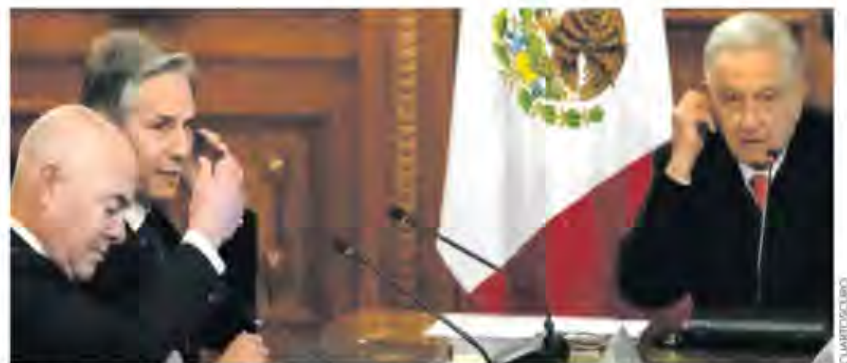
En plena crisis. Delegaciones definen reuniones periódicas, trabajar con Centro y Sudamérica, y dar soluciones regionales.