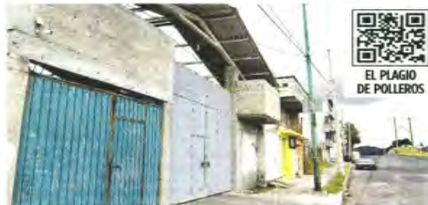
En esta bodega de la Colonia Parques Nacionales, en Toluca, presuntamente fueron secuestrados trabajadores de una empresa de pollo, el fin de semana pasado.

"Terminas siendo parte de todo este problema porque después no sólo es La Familia Michoacana la que cobra cuota. Yo como proveedor termino inflando precios a mis clientes para pagar la cuota, lo mismo que hago yo tienen que hacer otros compañeros polleros para que los dejen trabajar", expresó.