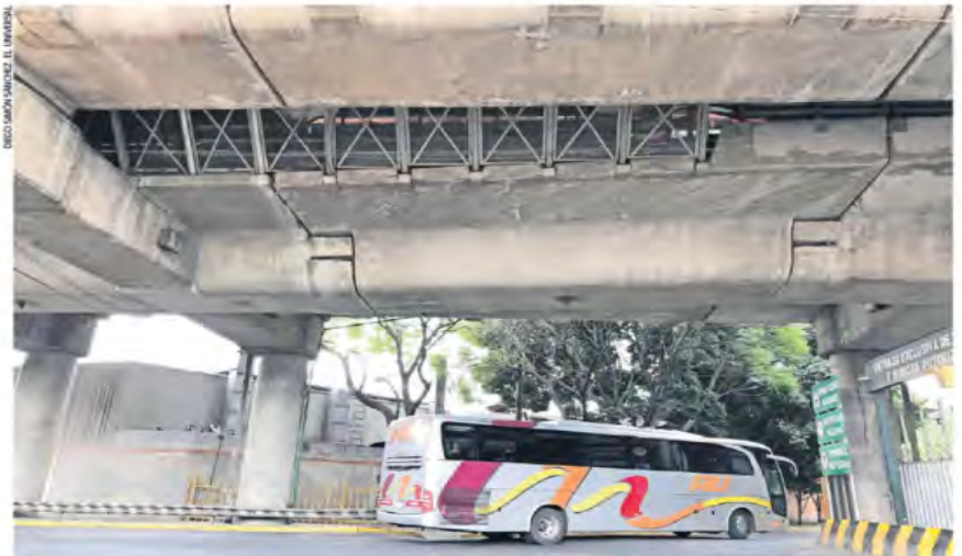
IMAGEN DEL DÍA DARÁN ARREGLADITA A LÍNEA B

Ante los hundimientos y para evitar vibraciones, cuatro de las 21 estaciones de esta línea del Metro serán intervenidas para renovar sus vías. Las obras iniciarán el 18 de enero y se prolongarán durante cinco meses, en los cuales se trabajará de madrugada, por lo que no se suspenderá el servicio. | METRÓPOLI | A13