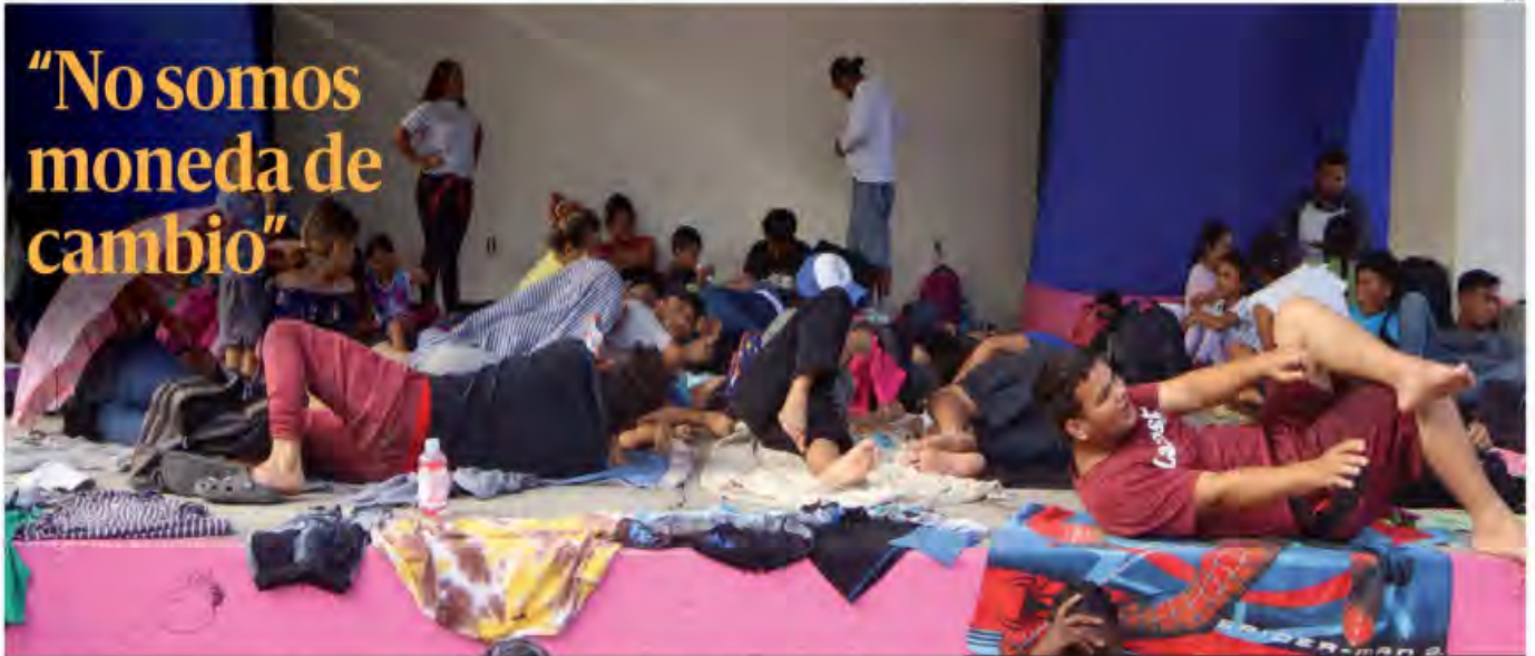
Migrantes descansan ayer en el municipio de Escuintla, Chiapas. El avance de la caravana de más de 6,000 migrantes, cuyos líderes señalan "no somos moneda de cambio" coincidió con la visita a México de una delegación de EU liderada por el secretario de Estado, Antony Blinken, para abordar el repunte migratorio. PAG 6