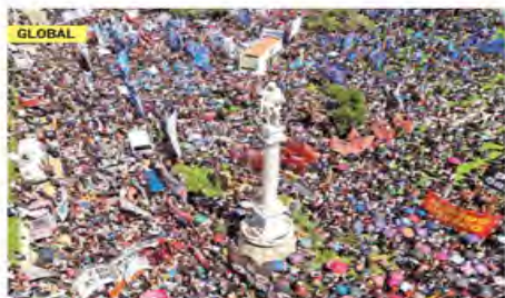
MILES PROTESTAN EN ARGENTINA

FUNCIÓN, PRIMERA, DINERO, COMUNIDAD, GLOBAL, EXPRESIONES Y ADRENALINA